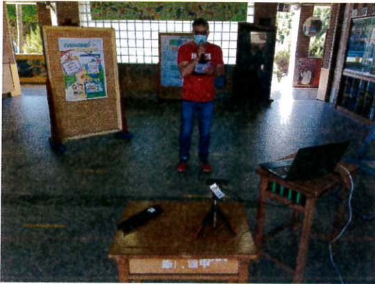
兒童權利公約宣導