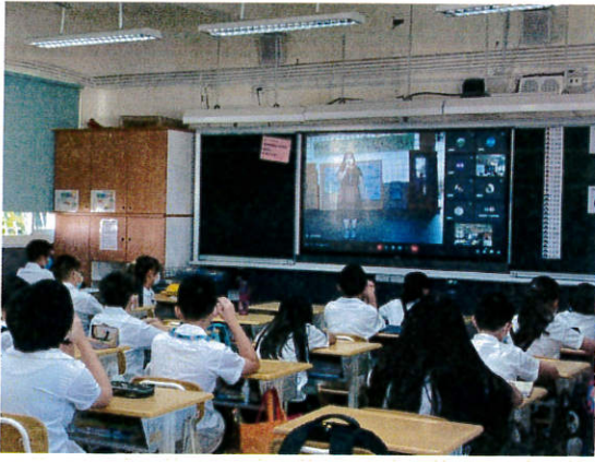
校長兒童朝會線上宣導