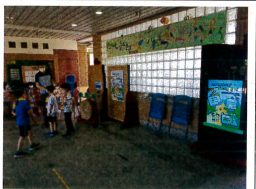
新生活動友善校園宣導