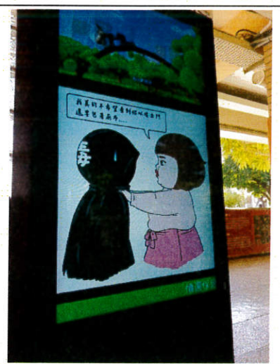
插畫家 H.H 先生「拒毒八招」