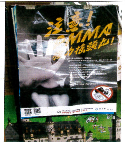
張貼毒品防治海報