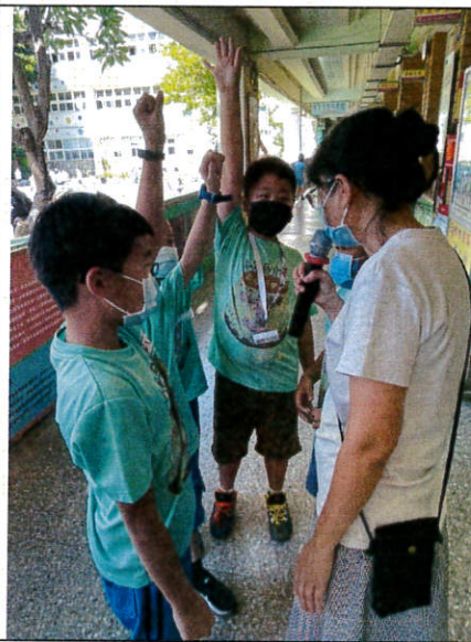
友善校園有獎徵答