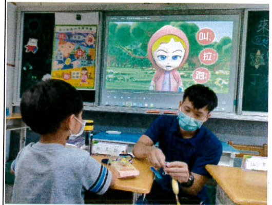
防身警報器入班宣導