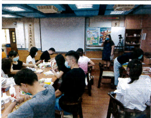
校長正向管教分享