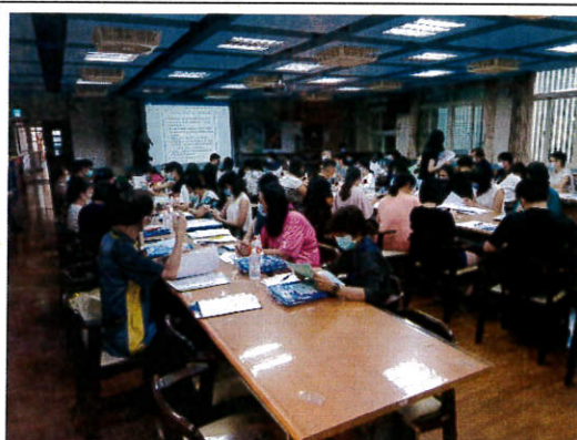
數位性別暴力「五不四要」