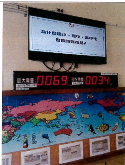
電視牆防毒微電影