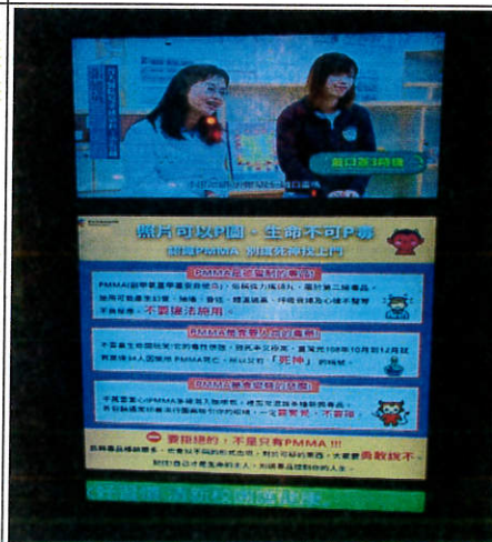
電子布告欄反毒宣導