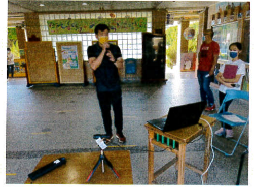
生教組長宣導性剝削、新興毒品、反霸凌防治