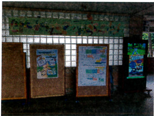
友善校園 校園海報