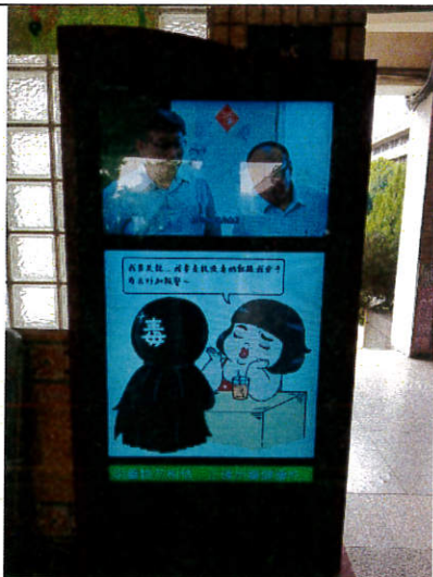
插畫家 H.H 先生「拒毒八招」