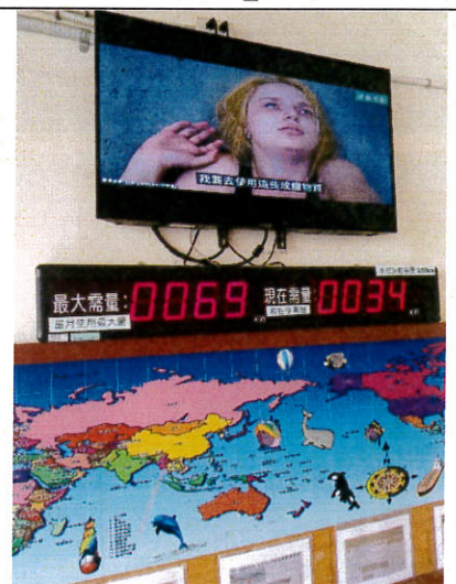
電視牆防毒微電影